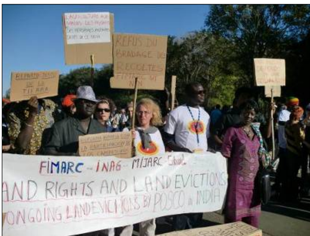
Foro Social Mundial - Dakar (Senegal) 2011

(Foro Social Mundial. Dakar, 2011 – "Llamamiento de Dakar contra los acaparamientos de tierras")