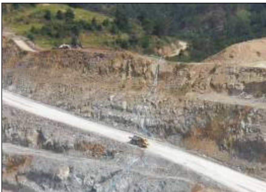
Mina de oro – Guatemala, 2011 (D. Herman)