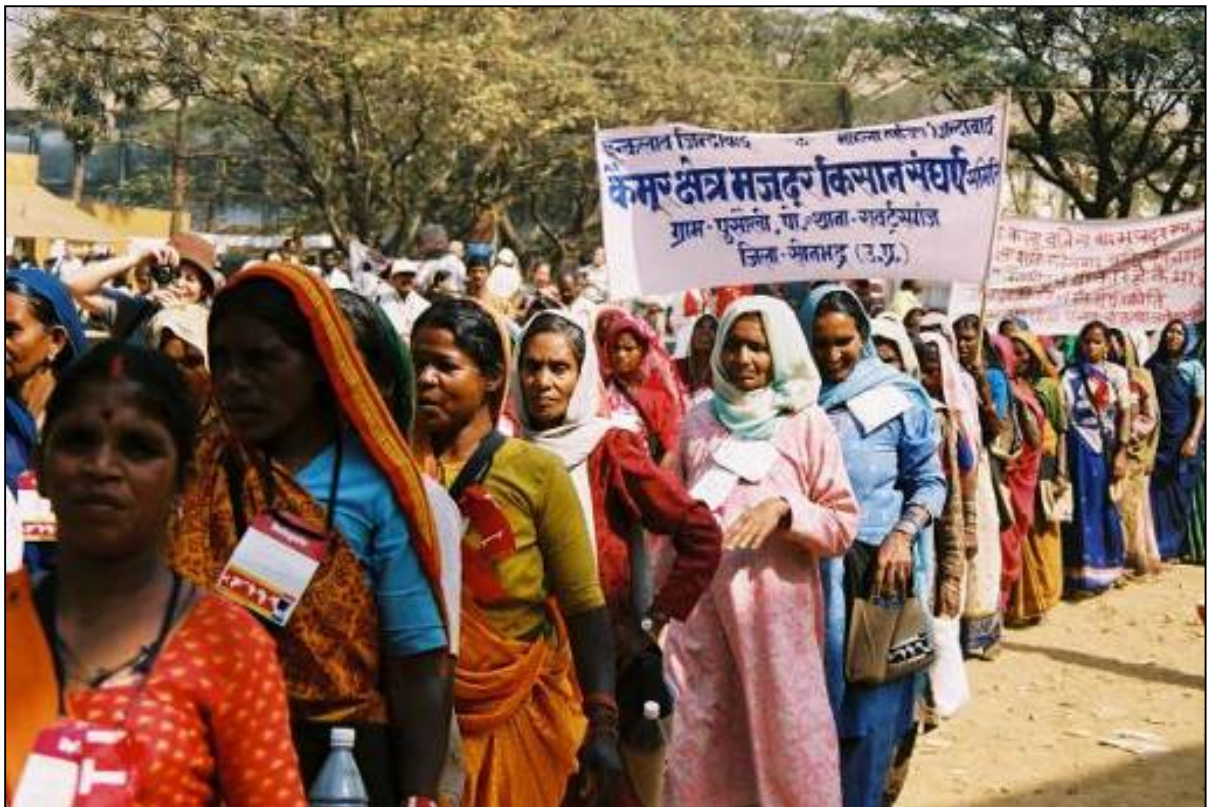
Marcha de las mujeres Dalits - FSM 2004

(Declaración del Comité ejecutivo de la FIMARC – mai 2005).