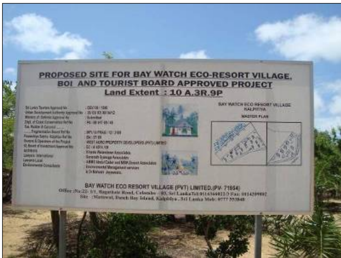
Acaparamiento fraudulento de tierras por el estado con vistas a la construcción de un eco complejo sobre la banda costera - Sri Lanka 2011