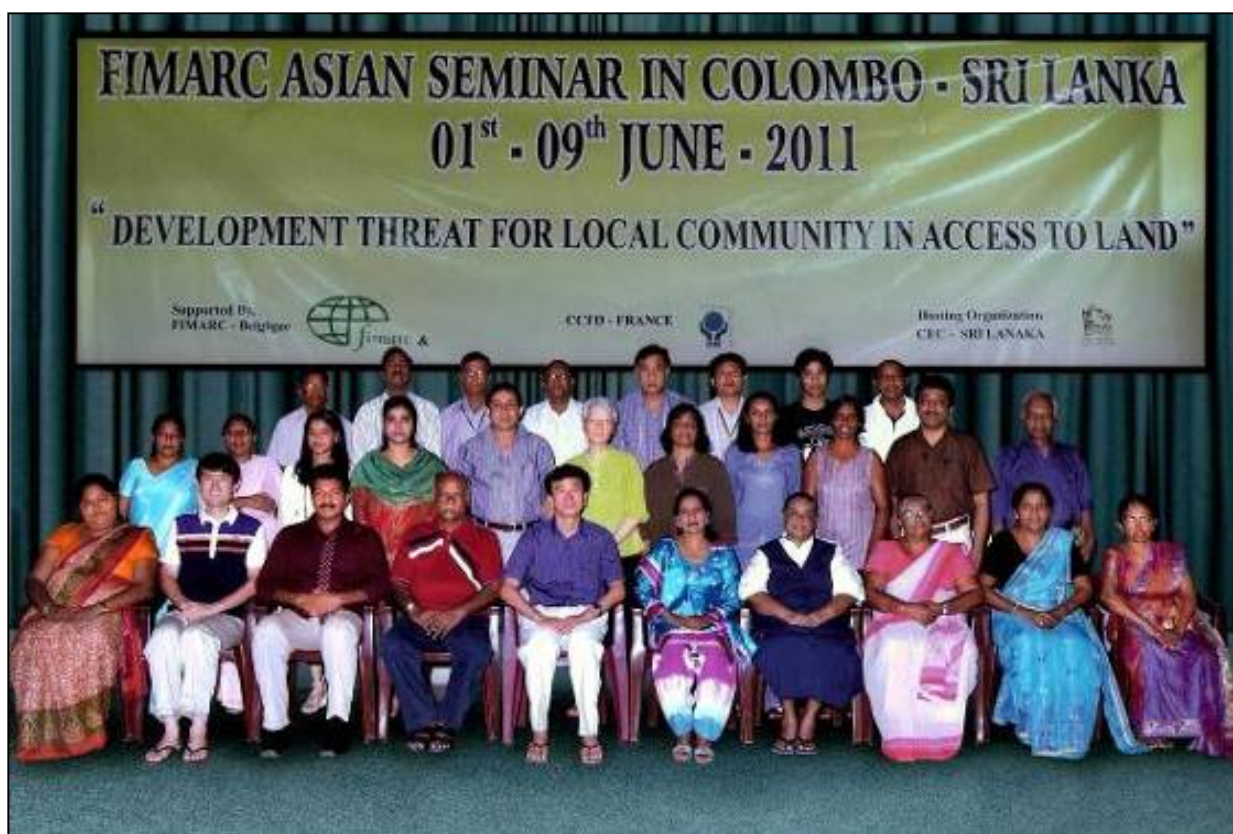
Seminario asiático - Sri Lanka, junio de 2011