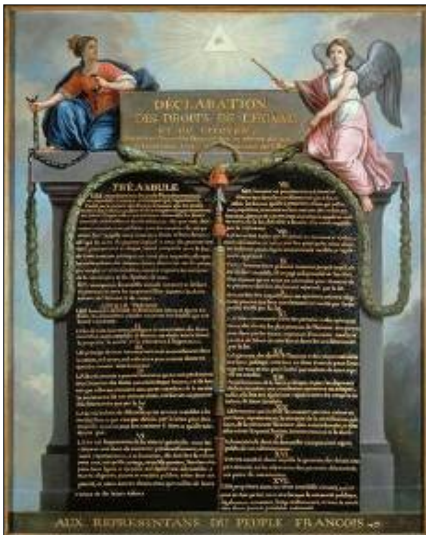
Representación de la Declaración de los derechos de hombre y del ciudadano de 1789 por Le Barbier. (Wikipédia)