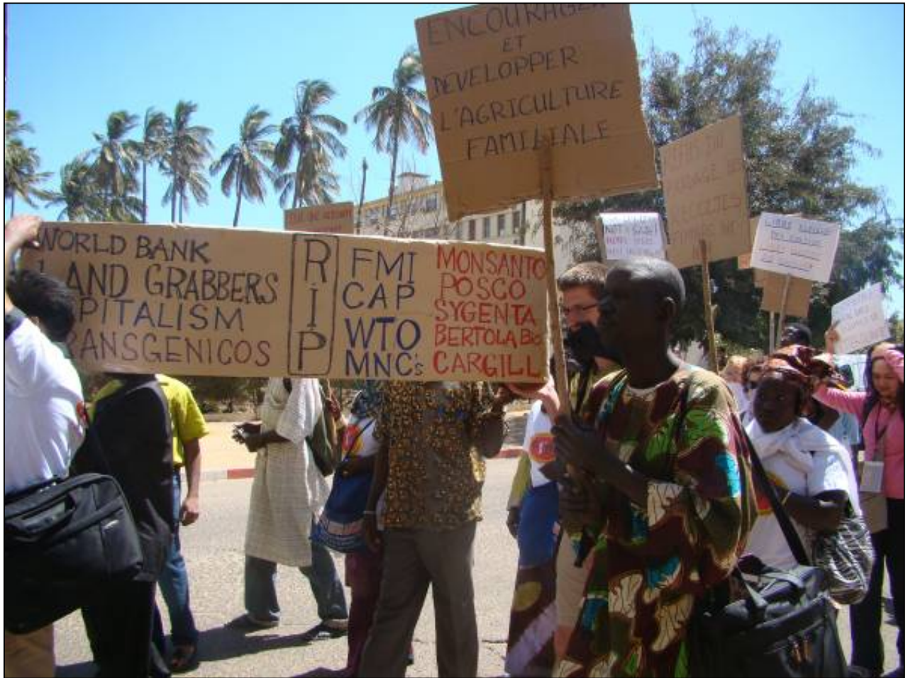
Foro Social Mundial – Dakar (Sénégal) 2011

En septiembre de 2010, el BM publicó un informe sobre las adquisiciones de tierras a gran escala. Después de dos años de investigación, el BM no ha encontrado ningún ejemplo convincente de "ganancias" para las comunidades pobres o los países, sino sólo una larga lista de pérdidas. Las empresas y los gobiernos interesados por los acuerdos han negado a compartir con el BM su información sobre inversiones agrícolas.